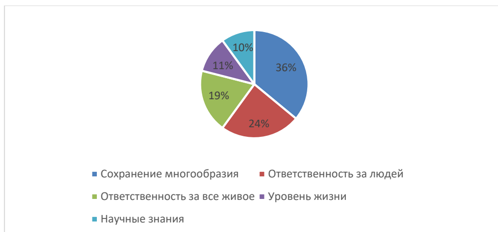
Рисунок 1 – Что, на Ваш взгляд, лежит в основе экологической культуры?